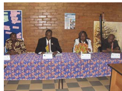
De gche à drte, le Maire de Bogodogo, le DG du CREPA, le Maire de Boulmiougou, et le Maire de Nongr-massom.