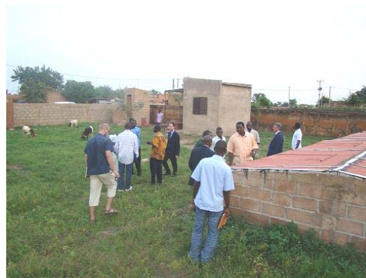
La délégation sur un des sites du projet