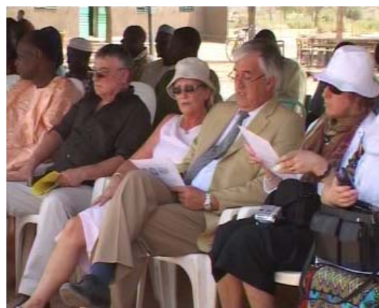
La délégation LANGELIN