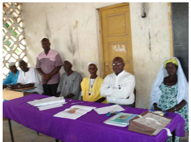
Présidium Le Directeur résident et quelques notables

AVEC LA FEDERATION « Battodem Gollem » regroupant vingt sept (27) associations avec trois mille trois cent trente adhérents (3330), la RN-Bissau a signé en novembre 2006 un partenariat. Cette structure est spécialisée dans le domaine de l'agriculture. Vingt trois (23) de ses animateurs ont bénéficié d'une formation en Hygiène et Assainissement. La formation s'est déroulée en Poular, (la langue nationale) et cela a permis à tous les participants d'acquérir une bonne maîtrise des modules: « Nous avons reçu beaucoup de formations de différentes institutions ; mais il faut le dire, nous n'avions jamais eu une formation aussi intéressante et facile à comprendre », de l'avis du Représentant de la Fédération. Pour plus d'informations, contacter le Directeur résident : crepagb@yahoo.com.br ou le sociologue : Coumbassa2006@hahoo.fr