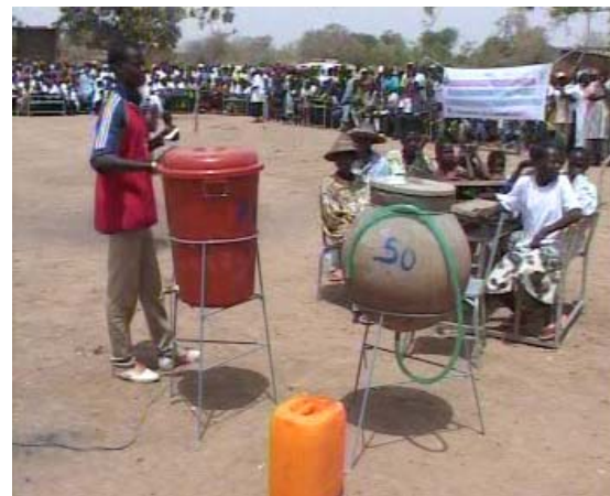
Séance de démonstration