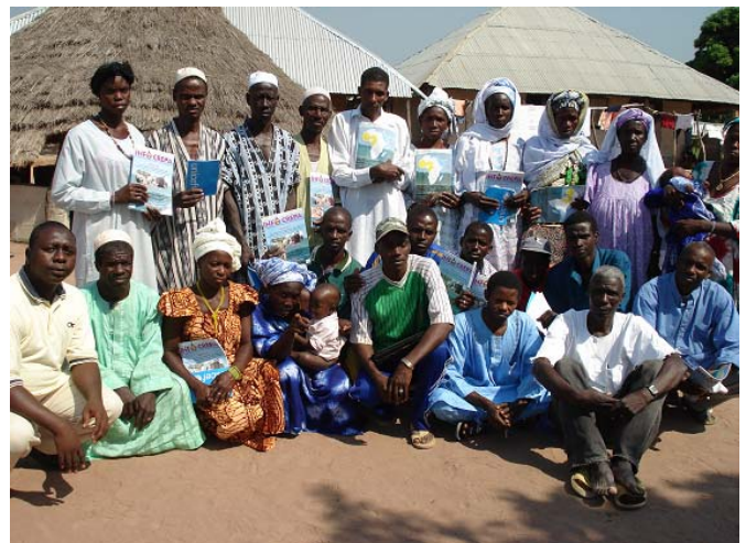
Photo de famille des participants à la formation

CENTRE REGIONAL POUR L'EAU POTABLE ET L'ASSAINISSEMENT A FAIBLE COUT