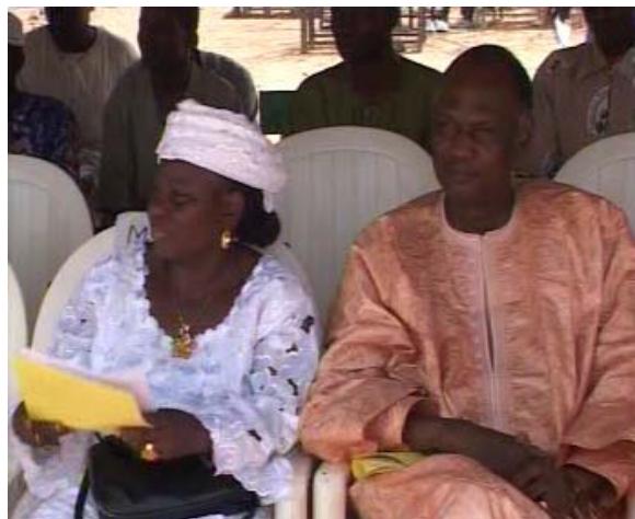
La Directrice Générale de l'Hôpital Yalgado OUEDRAOGO, Marraine du projet et le Directeur Général du CREPA