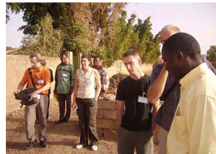
La visite environnementale au sein du CREPA

CENTRE REGIONAL POUR L'EAU POTABLE ET L'ASSAINISSEMENT A FAIBLE COUT