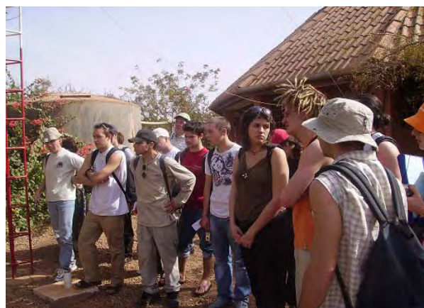
Les élèves devant les impluviums et la tranchée d'infiltration