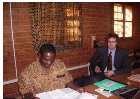
Le Secrétaire Exécutif du WAWP (journal en mains) et un membre du BGR